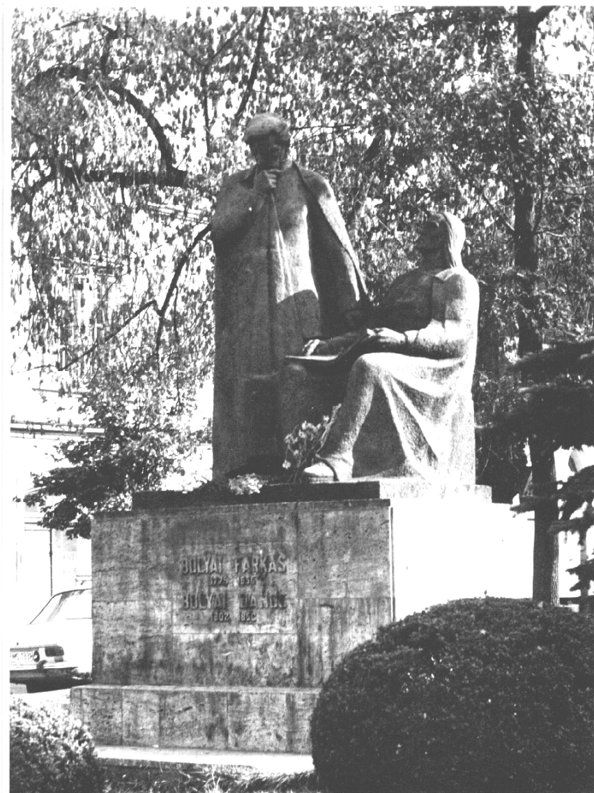
BOLYAI FARKAS ÉS BOLYAI JÁNOS SZOBRA MAROSVÁSÁRHELYEN