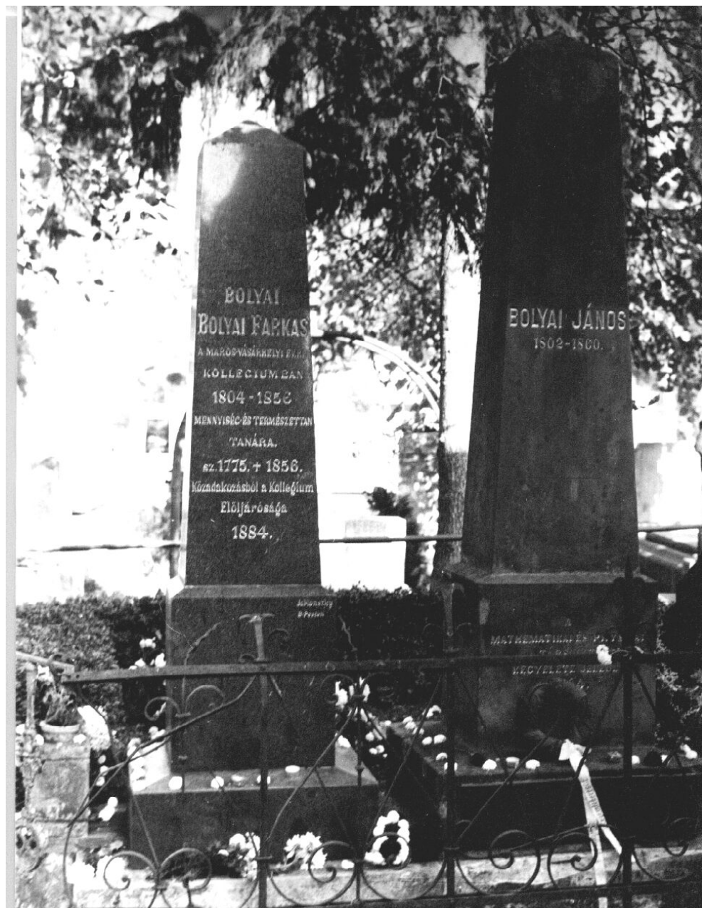
A KÉT BOLYAI SÍREMLÉKE MAROSVÁSÁRHELYEN